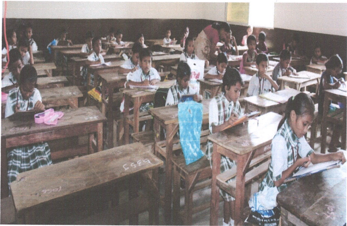
Photos of Spardharatna Competitive Exam